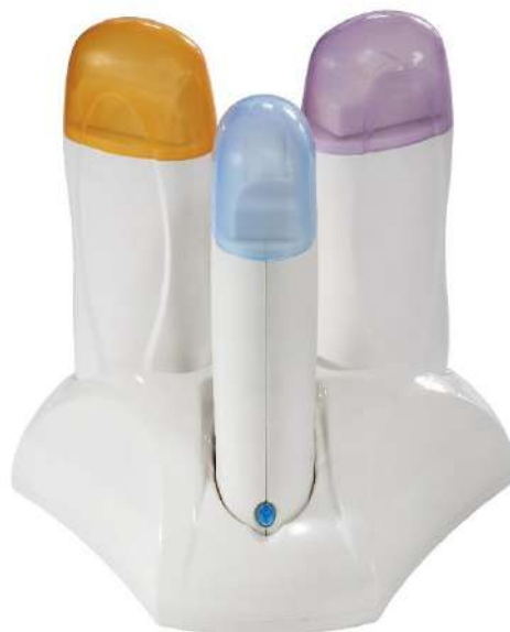
Chauffe cartouche Trio

Chauffe-cartouches de dimensions standards. Fenêtre pour le contrôle du niveau de la cire. Système d'interconnexion qui permet de relier jusqu'à 10 chauffe-cartouches du même type.