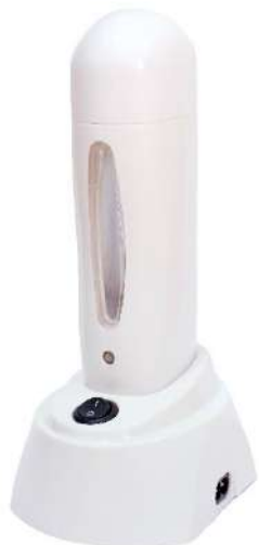
Chauffe cartouche Modulable

Chauffe-cartouches de dimensions standards. Fenêtre pour le contrôle du niveau de la cire. Système d'interconnexion qui permet de relier jusqu'à 10 chauffe-cartouches du même type.