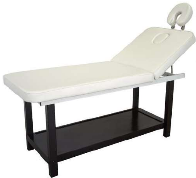
Table de massage - ROMBO

Table fixe à 2 plans avec structure en bois couleur wengé. Plate-forme inférieure pour rangement. Dossier réglable manuellement avec trou visage et tête réglable. Revêtement ivoire en PVC, facile à nettoyer.