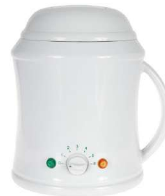
Chauffe cire – Sélection 800ml

Chauffe-cire pour pots de 800 g ou cire pastille, cassolette inclus Capacité: 750 ml