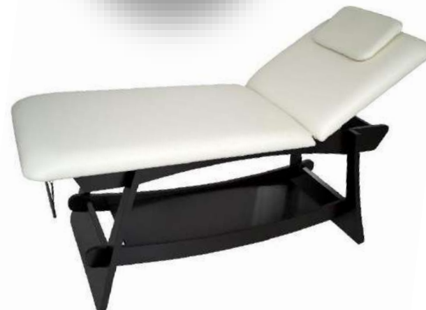
Table de massage - DELTO

Table fixe à 2 plans avec structure en bois couleur wengé. Plateau inférieur de rangement. Dossier réglable en plusieurs positions fixes. Trou visage et coussin repose-tête. Revêtement en PVC en couleur crème facile à nettoyer. Porte-rouleau inclus.