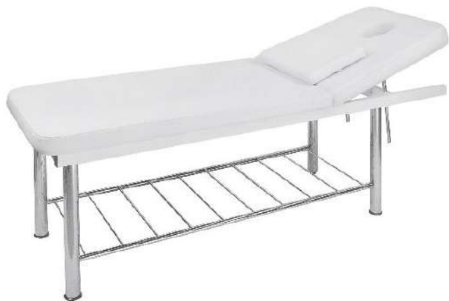
Table 2 plans - ILIM

Table fixe à 2 plans avec structure chromée. Dossier réglable manuellement Coussin repose tête amovible avec trou visage Revêtement en PU blanc de haute qualité et facile à nettoyer.