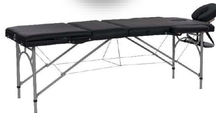
Table portable VASTIS

Table à 3 plans portable avec structure en aluminium légère et réglable par des tendeurs. Dossier et hauteur réglables en plusieurs positions fixes et pliable.