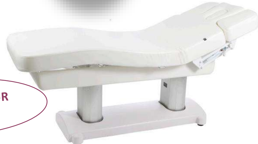
Table Electrique - TENSOR

contact : 40.42.39.00/ 87.28.36.18 – contact@medicis-distribution.com