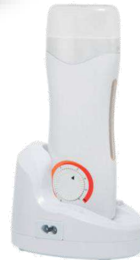
Chauffe cartouche Thermostat

Chauffe-cartouches de dimensions standards à triple logement. Bouchon tricolore: bleu, orange et violet.