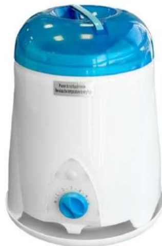
Chauffe cire – 750 ml

Une valeur sûre!! Grâce à sa structure en époxy et sa cuve en revêtement téflon, ce chauffe cire est très résistant. Thermostat gradué avec témoin lumineux. Qualité professionnelle