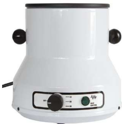
Chauffe cire TEFLON – 100w

Une valeur sûre!! Grâce à sa structure en époxy et sa cuve en revêtement téflon, ce chauffe cire est très résistant. Thermostat gradué avec témoin lumineux. Qualité professionnelle