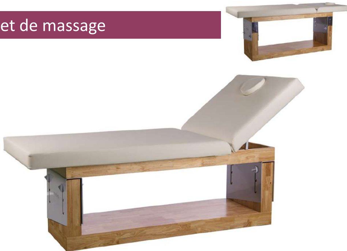
Table de massage SPA - OCCI

Lit fixe à 2 sections au design minimaliste en bois naturel de haute qualité. Système innovant pour régler la hauteur en 3 positions fixes et dossier réglable manuellement en 3 positions. Rembourrage en PU blanc de haute qualité qui facilite le nettoyage et le rembourrage de confort.