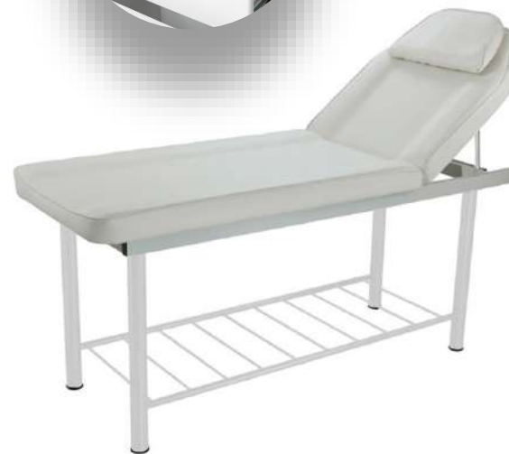
Table 2 plans - COXI

Poids : 28 kg Dimensions : 183x61x75 cm Poids maximal : 150 kg